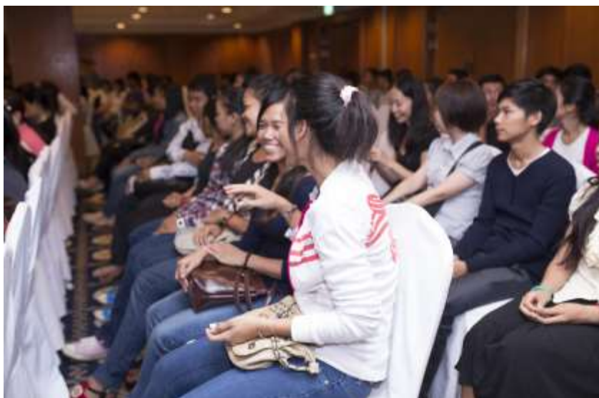
会場もわくわくドキドキ