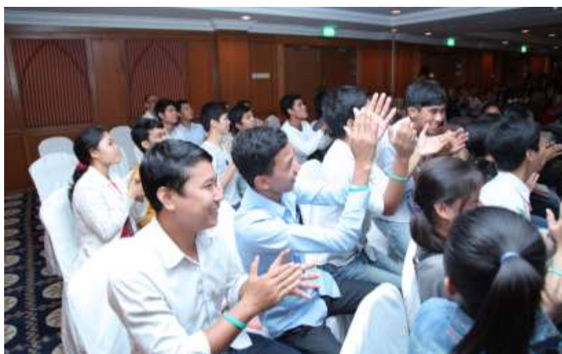
男性達が女性を応援する 途上国では貴重なシーン