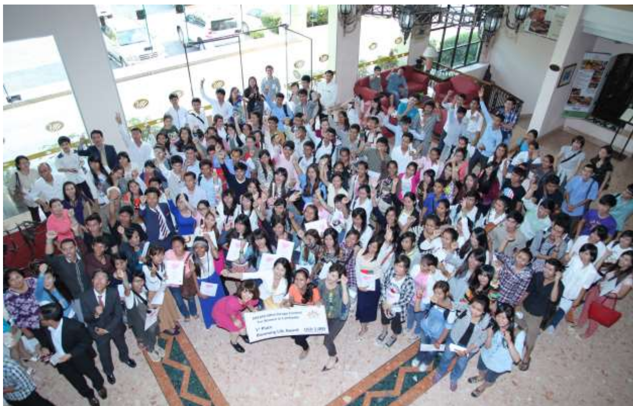
第4回 ドリーム・ガールズ・デザインコンテスト授賞式を終えて